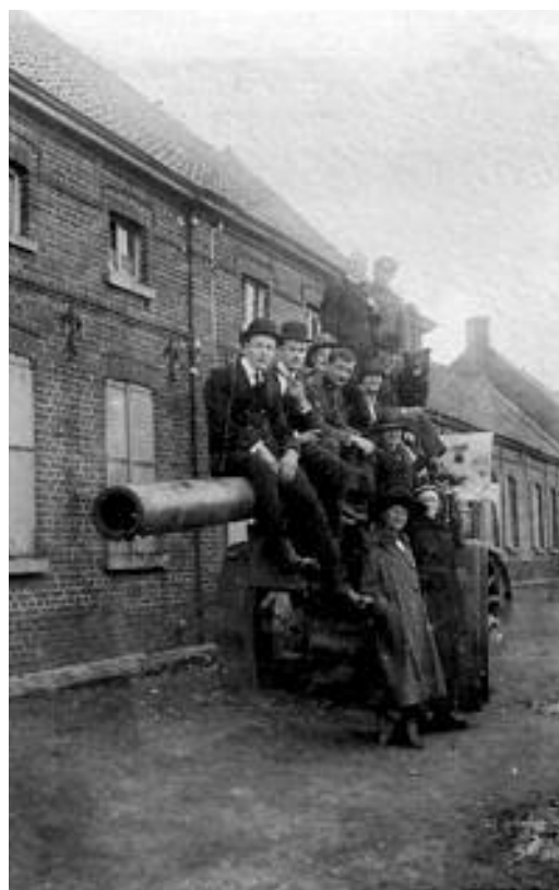
Kanon op de Knok